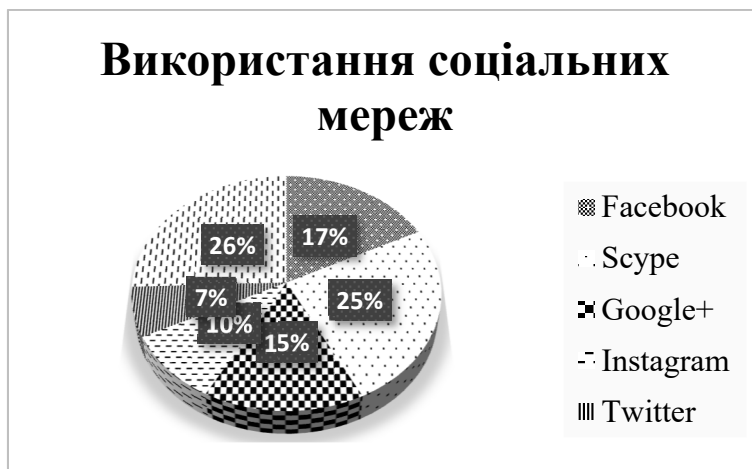
Рис. 2. Використання учнями та студентами соціальних мереж

На кафедрі інноваційних та інформаційних технологій в освіті інституту магістратури, аспірантури, докторантури Вінницького державного педагогічного університету імені Михайла Коцюбинського є досвід застосування соціальних мереж в навчальному процесі. Соціальні сервіси використовуються в інтеграції з LMS Moodle. Результати проведеного анкетування серед учнів Державного професійно-технічного навчального закладу «Вінницьке міжрегіональне вище професійне училище» всіх професій, що найбільш популярними електронними соціальними мережами Vkontakte, Instagram та Facebook. Крім того встановлено, що всі респонденти використовують також соціальні сервіси, Google+, Twitter, Skype (рис. 2).