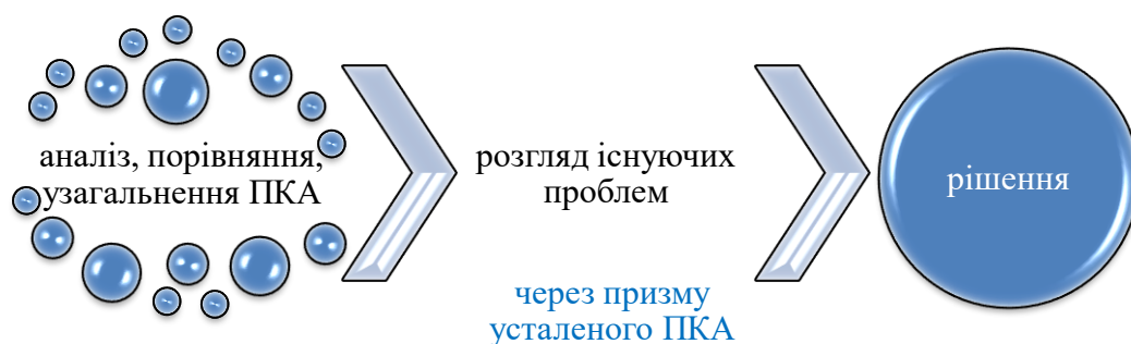
Рис. 3. Використання понятійно-категоріального апарату при розв'язанні дослідницької проблеми

Порівняння та узагальнення існуючих базових дефініцій понятійно-категоріального апарату (ПКА), розгляд існуючих проблем та врешті-решт формування пропозицій стосовно заходів, які можуть бути вжиті для їх вирішення – процедура, якої на нашу думку мають дотримуватися дослідники для отримання авторитетного, практико зорієнтованого результату (рис. 3).